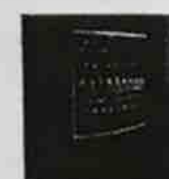
tavola un vino portato come presente da un amico. Metti che quel vino foss...

Carignano del Sulcis in purezza Buio Buio '08 Az. Mesa, Il rosso sardo non è solo Cannonau